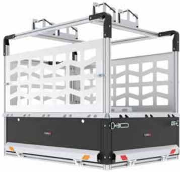
Aufbau mit Sonderausstattung