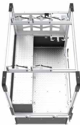
Ansicht von oben